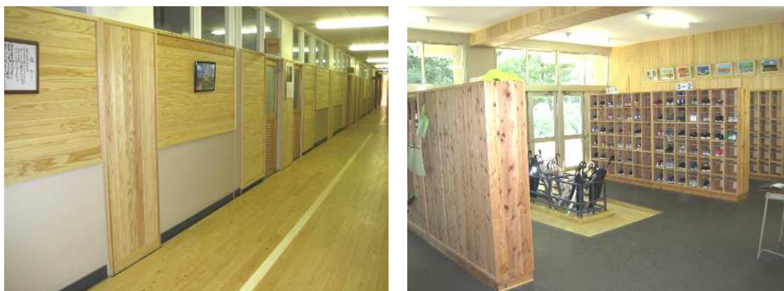
校舎内装木質化事業（中央中学校）