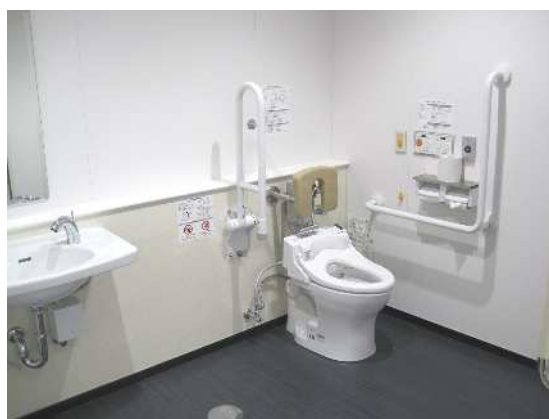
学校トイレ改修事業（泉小学校）