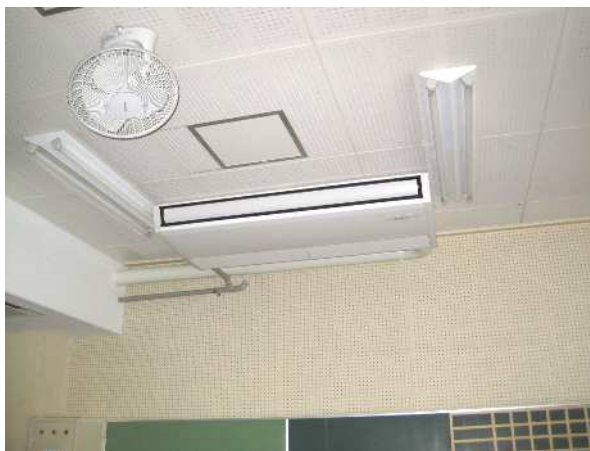
防音校舎改修事業（北中小学校）