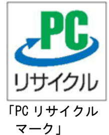
「PC リサイクル マーク」

ただし、市と協定を結ぶ小型家電リサイクル法による認定事業者で回収依頼をする場合は、この限りではない。