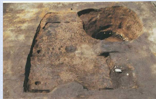
① 全景 (右上は中～近世の井戸跡)