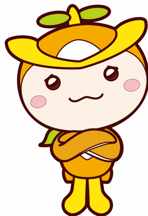
所沢市イメージマスコット トコロん