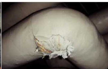
エルボ部に使用 石綿含有保温材