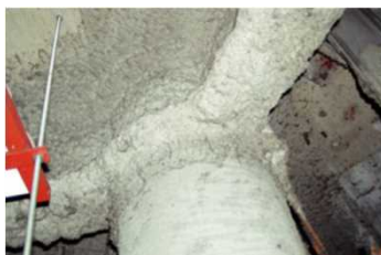
柱や梁に施工 吹付け石綿