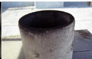
煙突の内側に使用 石綿含有断熱材