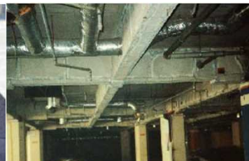
鉄骨を被覆して保護 石綿含有耐火被覆材