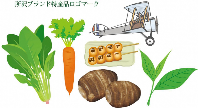
所沢ブランド特産品ロゴマーク

2020年の「ところざわサクラタウン」の完成や東京オリンピック・パラリンピックの開催を踏まえ、外国人観光客を含めて広く販売できるような魅力ある特産品の創出を、市が支援いたします。