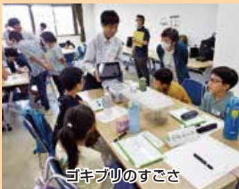
ゴキブリのすざさ