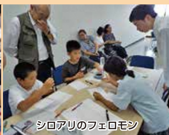
シロアリのフェロモン