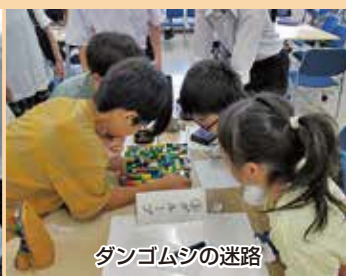
ダンゴムシの迷路