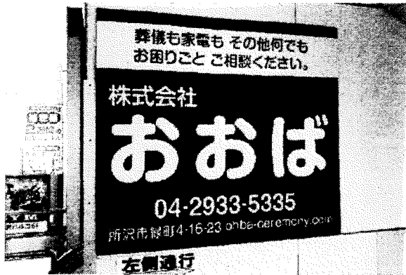
新所沢駅にある看板