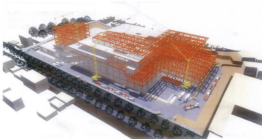
「(仮称) ところざわサクラタウン」工事計画イメージ図 (2019年2月頃) ※イメージ図です。今後変更になる可能性があります。

04-2998-9027 a9027@city.tokorozawa.lg.jp