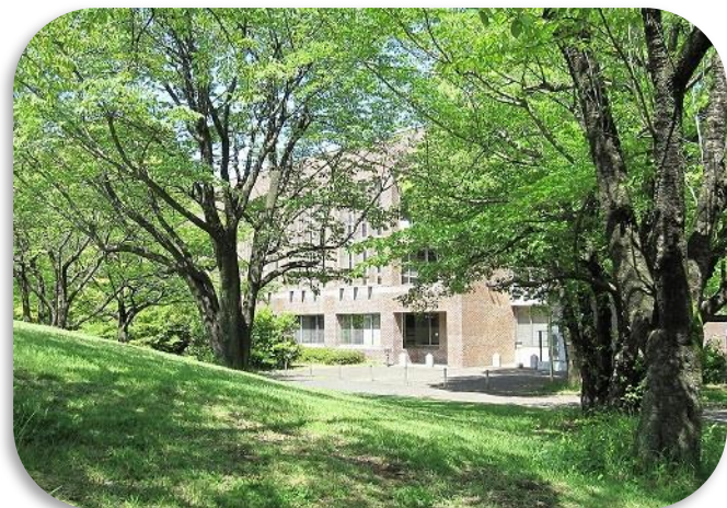
木漏れ日の中の本館（夏）

加えて、平成31（2019）年3月策定の「第3次所沢市子どもの読書活動推進計画」「所沢市生涯学習推進指針」等を踏まえ、図書館施策をさらに総合的・計画的に進めてまいります。