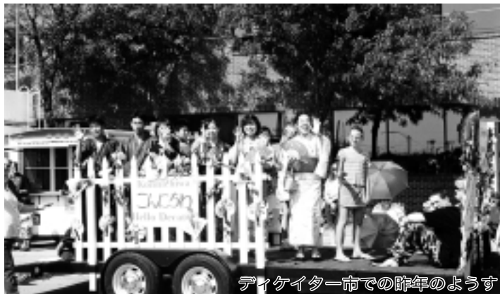
ディケイター市での昨年のような

ディケイター、安養両市への派遣学生を募集します ディケイター市への学生派遣 訪問都市 ディケイター市(アメリカ合衆国イリノイ州) 実施期間 7月25日(休)出発〜8月7日(休)帰国(ディケイター市内10泊・シカゴ市内前後各1泊) 募集人員 8人(応募資格別掲) 参加費 15万円程度 ■安養市への学生派遣