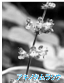
アキノタムラソウ

昔は「リョウブ飯」という言葉がありました。春の若葉を保存し、飢乏の時の代用食として利用してきました。特に平安時代には、リョウブの植栽と葉の採集、貯蔵を法律で強制したという記録があります。「令法」と書いてリョウブと読ませるのは、この理由によるのでしょうか。