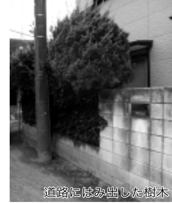
道路にはみ出した樹木

道路にはみ出した樹木は、歩行者や自転車の通行の妨げになるばかりでなく、走行中の自動車やバイクからは、歩行者や交通標識等の確認がしづらくなり、交通事故の原因になりかねません。 限られた道路のスペースを安全かつ快適に利用できるよう、定期的に樹木の剪定を行ってください。 また、車の出入りのため、段差にブロック等を置いている方も見受けられますが、場合によっては雨水を取り込むための柵にふたをした状態になり、道路が冠水してしまいます。 このような段差を解消するためには、工事費は自費となりますが、市へ申請することにより、歩道や側溝の切り下げ工事を施工することができます。 安全で快適な道路環境づくりに向け、皆さんのご理解・ご協力をお願いします。 問い合わせ 道路維持課 (☎998-9168)