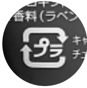
図1のマークがある容器包装は、すべて「プラスチック」に分別してください。このマークが付いていなくても同じようなものは、同様に「プラスチック」として分別してください。