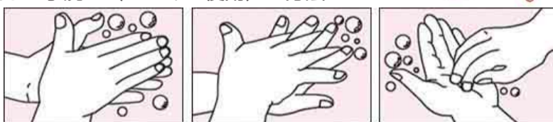
1.手のひらをこする。 2.手の甲もよくこする。 3.指先も洗う。