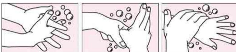
4.指の間も洗う。 5.親指と手のひらも... 6.手首も忘れずに...