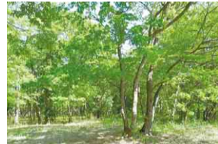
▲くぬぎ山・駒ヶ原の森

ウォーキングは、生活習慣病予防に効果があります。日常生活の中で1日に平均して歩く時間は、わずかな差ですが、「30分未満」の方が35・5%と一番多い結果となりました。