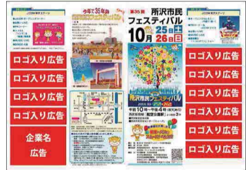
▲掲載イメージ(前回プログラム)

◎申込書は地域づくり推進課、実行委員会HP ( https://opencity.jp/tokorozawa/pages/gp/tokofes/ ) で入手できます。