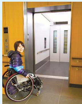
▲車いすでも使いやすいウォークスルー式エレベーター

1体育館はバドミントン、バスケットボール、卓球などができ、一般利用も可2ボランティア団体などが活動できる部屋を複数備える