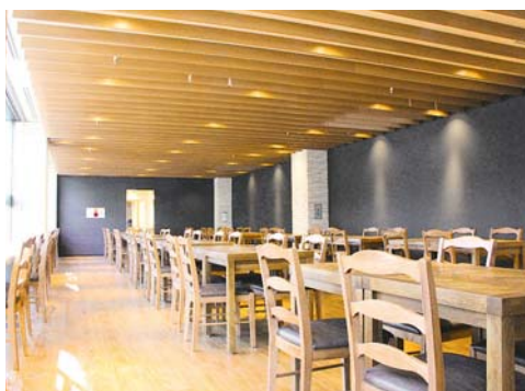
▲落ち着いた雰囲気の「響」店内では、食べたり飲んだりおしゃべりしたり。

ミューズ内のレストラン「響」は内装を一新！木目調の店内は、公演前後に一息つきたくなる癒やしとくつろぎの空間です。