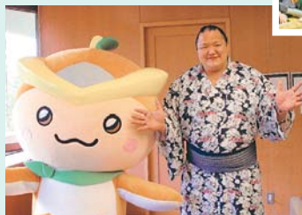
▲一緒に「どすこーい!」