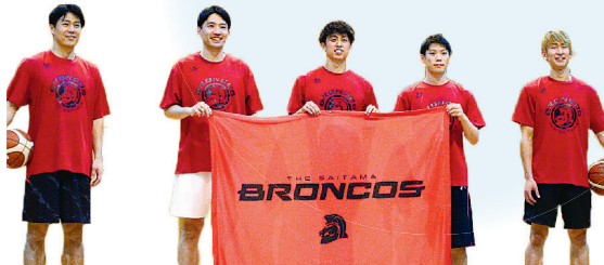
▲さいたまブロンコス (プロバスケットボールチーム)