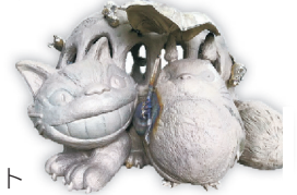
▶制作中のモニュメント