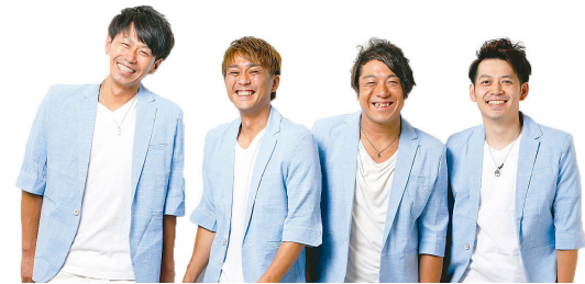
▲JAYS GARDEN (J-POP ボーカルグループ) 70周年を記念して、所沢をイメージした楽曲「つなぐ」を制作中♪