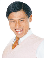
▲オードリー 春日俊彰さん (お笑いタレント)