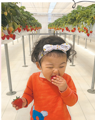
▲豪快な食べっぷり 手の平サイズの大きなイチゴを がぶり！小さなお口で悪戦苦闘 ●あーちゃんママ（山口）