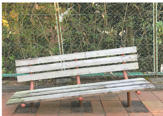
▲珍百景！？ 椿峰の緑道にて。壊れているのか と思いきや、坂道で座面を水平に 設置してあるだけでした ●カーカ（西所沢）

▶ hiroba@city.tokorozawa.lg.jp 〒359-8501広報課みんなのひろば (住所不要)