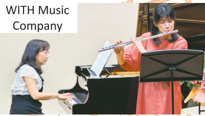
▲WITH Music Company