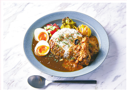
▲社員がこだわり抜いた角川食堂のカレー