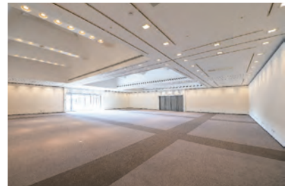
▲ザ・スクエア（展示室）