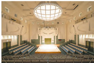
▲キューブホール（小ホール）