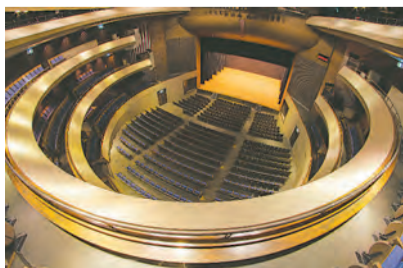
▲マーキーホール（中ホール）